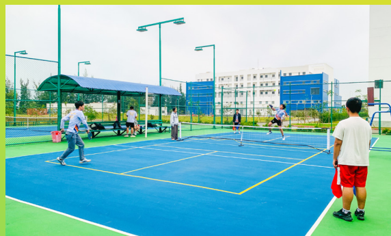
Sân thể thao ngoài trời Outdoor Sports Court