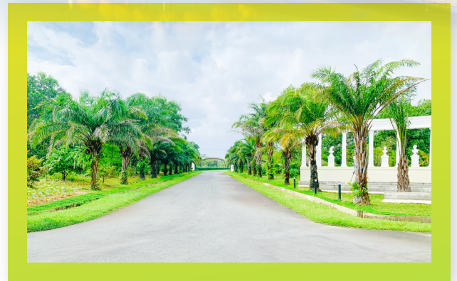
Lối đi từ cổng chính đến tòa nhà Pathway from the main gate to the building