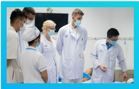
Sinh viên Y khoa Hungary Hungarian Medical Students

Thông qua các hoạt động trao đổi này, PCTU không chỉ kết nối sinh viên với thế giới mà còn tạo ra một môi trường học tập năng động, giúp sinh viên phát triển toàn diện và sẵn sàng cho những cơ hội lớn trong tương lai.