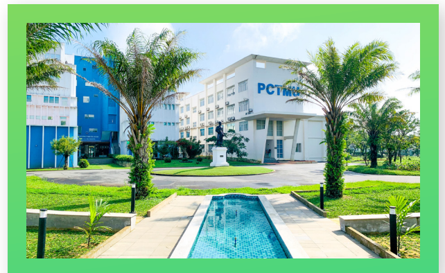
Một góc của Bệnh viện mô phỏng A corner of the Simulation Hospital