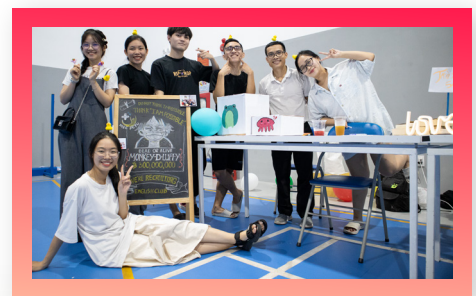
Câu lạc bộ Tiếng Anh Y khoa PCTMU Medical English Club