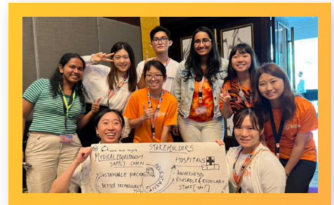
Sinh viên PCTU cùng bạn bè quốc tế tại Philippines PCTU Students with International Friends in the Philippines