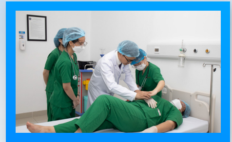
Mỗi giảng viên lâm sàng hướng dẫn tối đa 5 sinh viên/nhóm Each clinical instructor supervises up to 5 students per group.