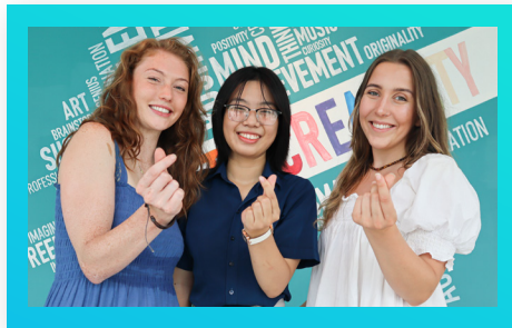
Sinh viên Y của ĐH Manchester, Anh Medical Students of Manchester University, England