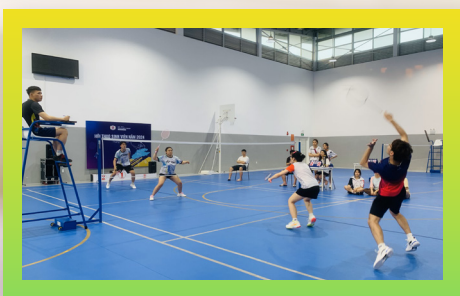
Câu lạc bộ Cầu lông PCTU Badminton Club