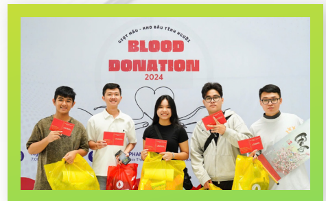
Sinh viên PCTU với hoạt động hiến máu PCTU students participate in blood donation