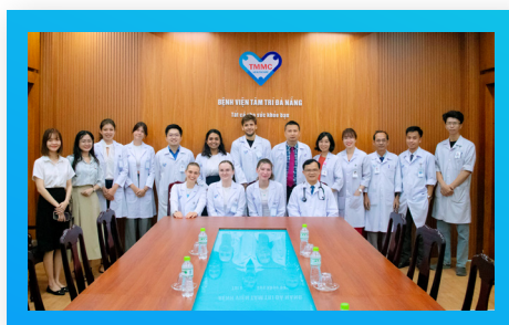
Sinh viên Y khoa Mỹ, Ba Lan... Medical Students from the U.S., Poland, and More