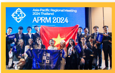
Sinh viên PCTU tại Hội nghị Sinh viên Châu Á - Thái Bình Dương, Thái Lan PCTU Students at the Asia-Pacific Student Conference in Thailand