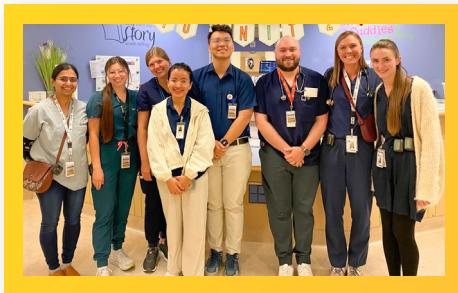
Sinh viên PCTU thực tập tại Bệnh viện Nhi Alberta, Canada PCTU Students Interning at Alberta Hospital, Canada