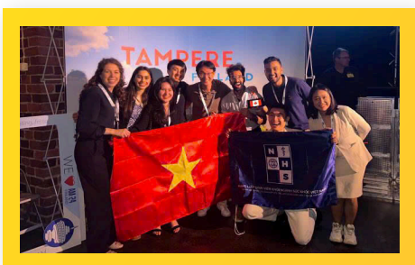
PCTU – Đại diện duy nhất của Việt Nam tại HN SV Y khoa Thế giới ở Phần Lan PCTU – Vietnam's Sole Representative at the World Medical Student Conference in Finland