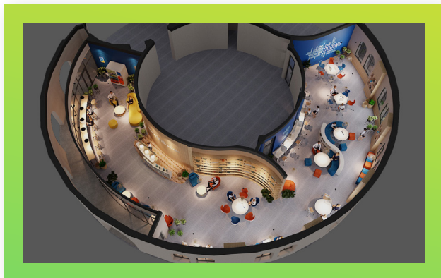
Thư viện nhìn từ trên cao The library viewed from above