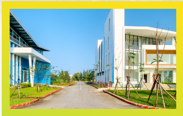
Trung tâm nghiên cứu Y sinh Biomedical Research Center