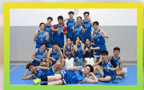
PCTU Eagles - Câu lạc bộ Bóng Rổ PCTU Eagles - Soar High with Basketball