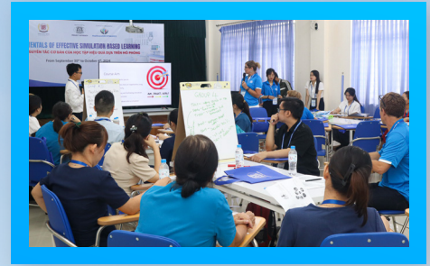
Chuyên gia Canada tập huấn phương pháp dạy mô phỏng tiền lâm sàng cho GV Canadian experts train faculty in preclinical simulation teaching.

Suất học bổng xét tuyển thẳng giá trị lên đến 100% học phí trong 04 học kỳ