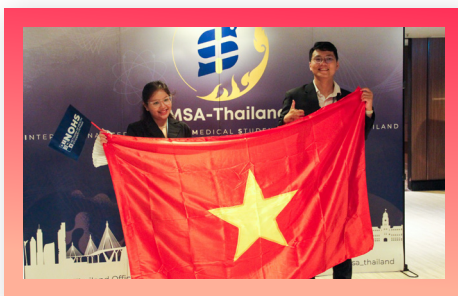
Mạng lưới sinh viên y khoa - PhanMed PhanMed - The Medical Student Network