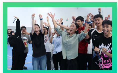
Sinh viên PCTU – Hết mình với đam mê, rực cháy tuổi thanh xuân! PCTU Students – Embracing Passion, Igniting Youth!