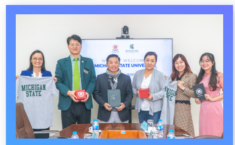
Hợp tác cùng ĐH Bang Michigan, Mỹ Collaboration with Michigan State University, USA