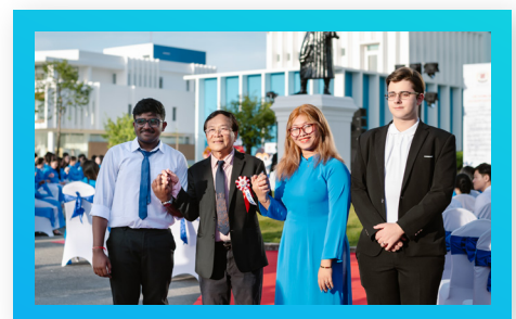
Sinh viên Y khoa Myanmar & Ấn Độ Medical Students from Myanmar, India