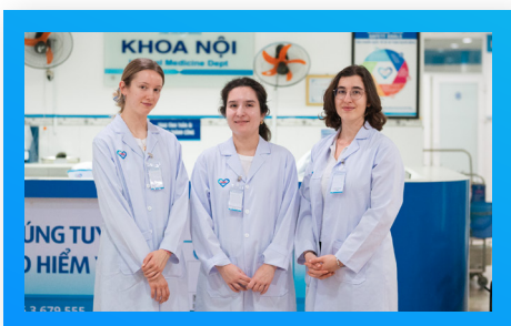
Sinh viên Y khoa Đức German Medical Students