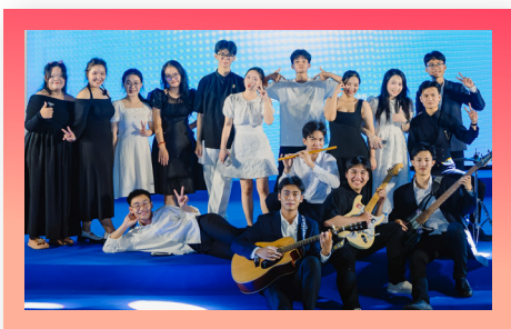
Câu lạc bộ âm nhạc Dopa-Dopin Dopa-Dopin Club: Where Passion Harminze

Whether it's a love for the arts, academic exchange, physical fitness, or spreading kindness, at PCTU, students can explore a variety of clubs tailored to their interests.