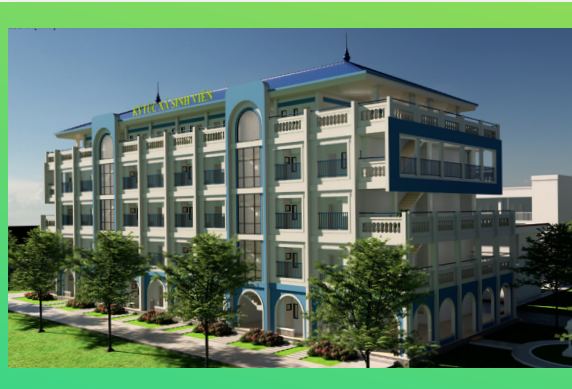
Ký túc xá sinh viên Student Dormitory