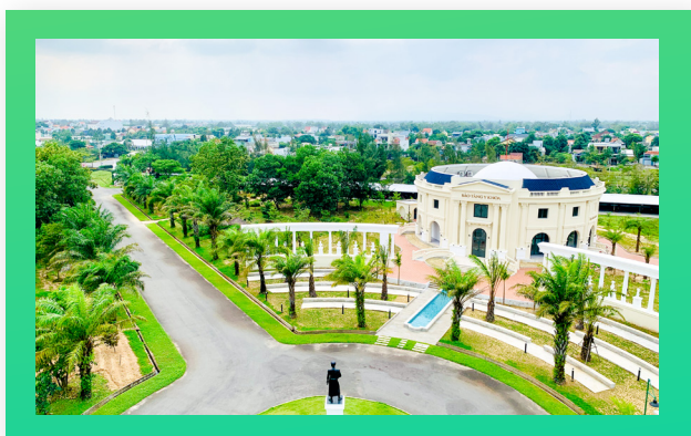
Bảo tàng và Thư viện Y khoa Medical Museum and Library