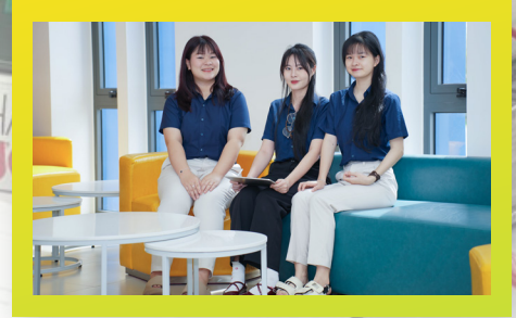
Sinh viên ngành Quản trị bệnh viện Hospital Management Students