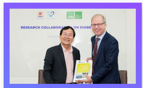
Hợp tác cùng ĐH LMU - Đức Research Collaboration with LMU University, Germany