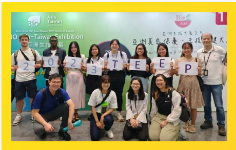
Sinh viên PCTU tại Đại học Taipei, Đài Loan PCTU Students at Taipei University, Taiwan

Through these exchange programs, PCTU not only connects students with the world but also fosters a dynamic learning environment, equipping them with comprehensive skills and preparing them for greater opportunities in the future.