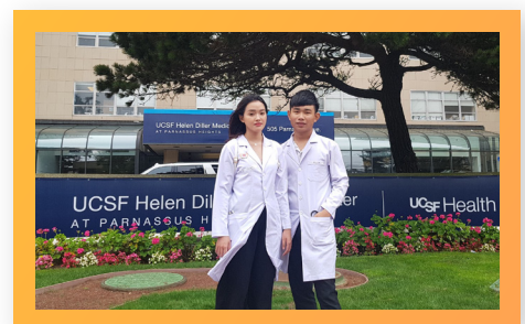
Sinh viên PCTU kiến tập lâm sàng tại Đại học UCSF, Mỹ PCTU Students in Clinical Observership at UCSF, USA