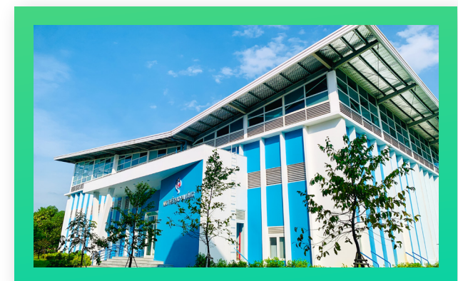
Nhà thể thao đa năng Multipurpose Sports Hall