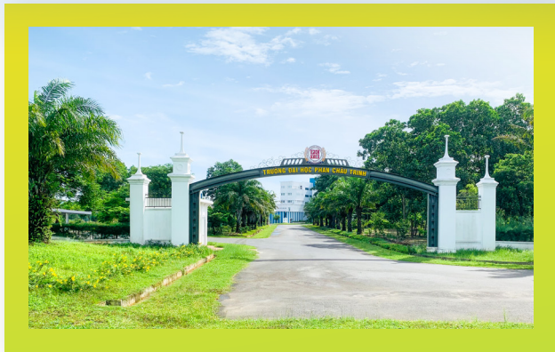
Cổng chính Entrance