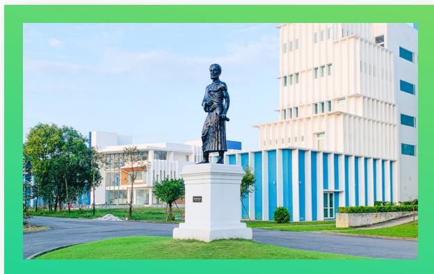
Tượng đài Hippocrates Hippocrates Monument