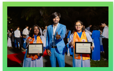
Niềm vui khi nhận được học bổng The Joy of Receiving a Scholarship