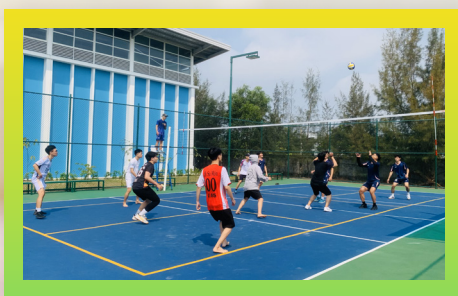
Câu lạc bộ Bóng Chuyền Volleyball Club