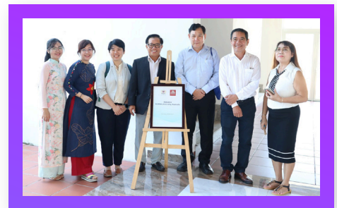
Hợp tác cùng ĐH Griffith, Úc Collaboration with Griffith University, Australia

With an extensive global network, PCTU students gain access to world-class education, enhance their professional skills, and confidently integrate into the international medical community!