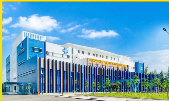
Bệnh viện Đại học Y khoa Phan Châu Trinh Phan Chau Trinh Medical University Hospital